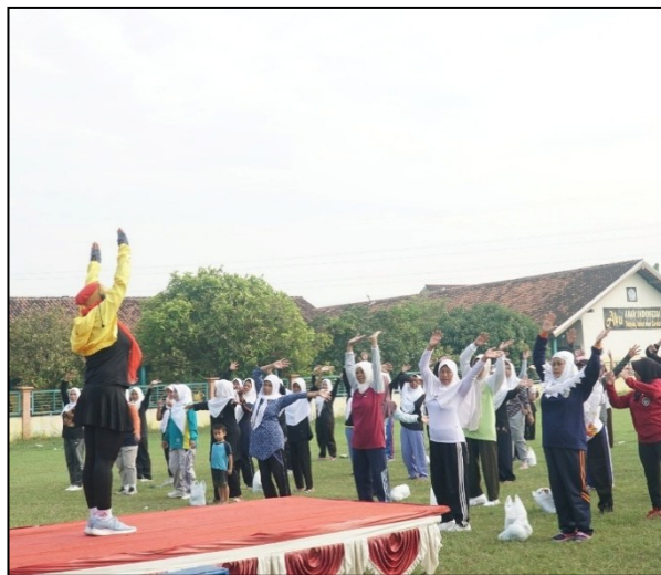
Senam Bersama dalam peringatan hari Lansia ke 27 di Kabupaten Demak