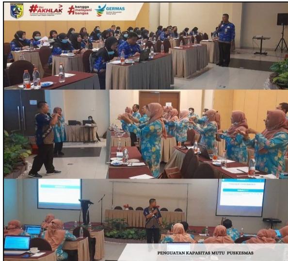
Peningkatan Mutu Puskesmas