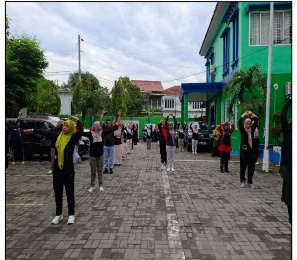
SENAM GERMAS Bersama di lingkungan Dinas Kesehatan Daerah