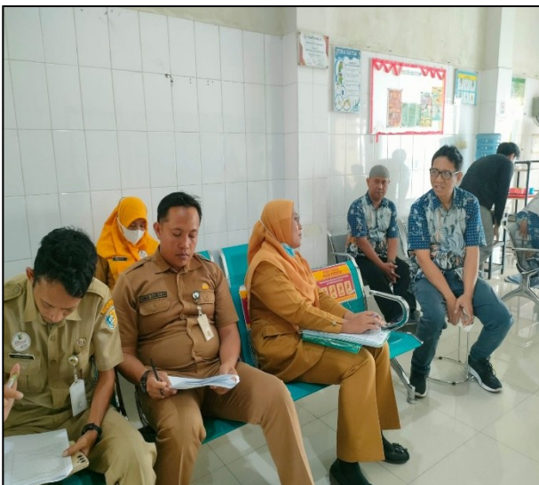
Visitasi Perpanjangan Klinik