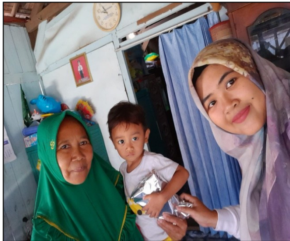
Monitoring PMT Lokal