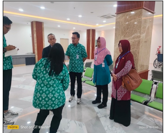
Visitasi Rumah sakit dalam rangka Ijin Operasional