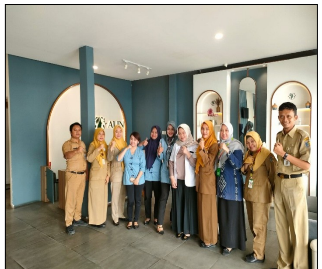
Visitasi ijin operasional praktek mandiri