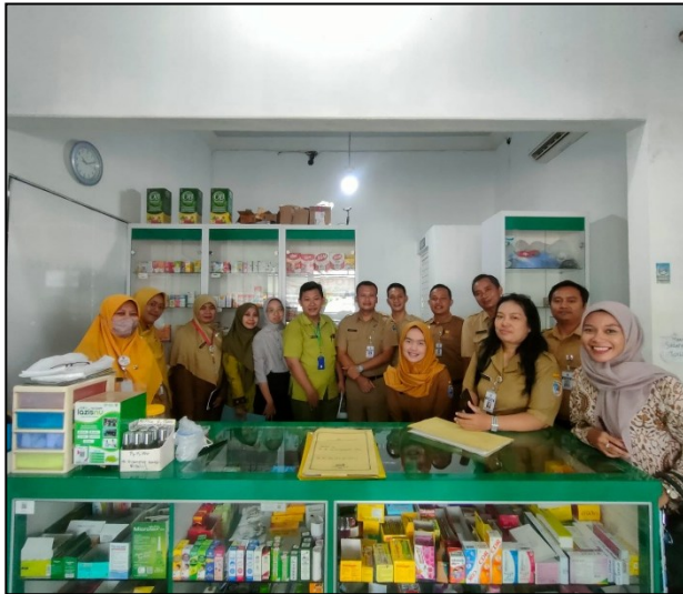
Kegiatan Visitasi Perpanjangan Apotek bersama Tim DINKESDA dan Dinpmptsp