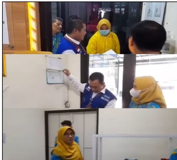
Survey Penilaian Akreditasi Puskesmas