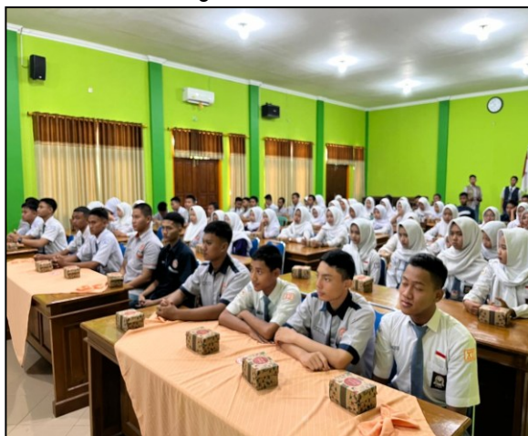
Kegiatan Edukasi Remaja untuk Waspada DBD