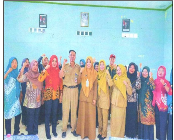
Sosialisasi Dan Skrining Malaria