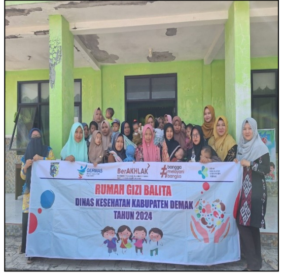
Pelayanan Rumah Gizi Balita