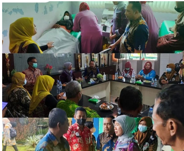
Pelayanan KB Pasca Salin bersama tim BKKBN RI