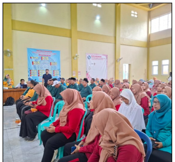
Peningkatan Peran PKK dan Kader dalam Pencegahan dan penurunan AKI, AKB, dan Stunting