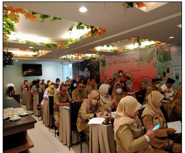
Koordinasi penguatan sistem rujukan DES PSC119