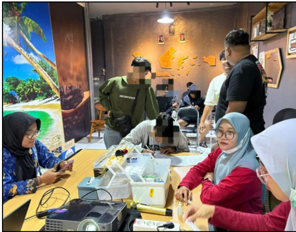
Sosialisasi dan Skrining HIV/AIDS