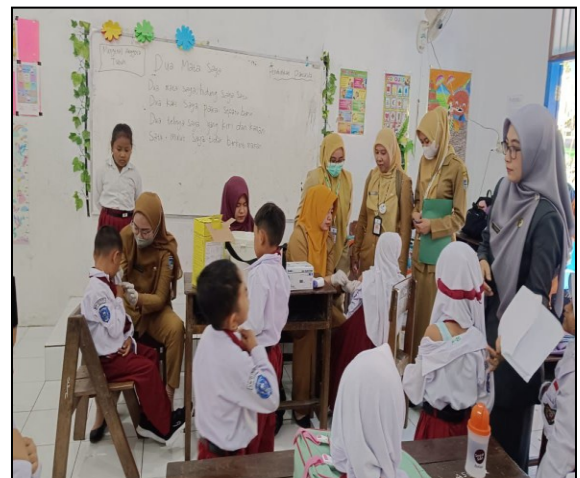
Kegiatan BIAS (Bulan Imunisasi Anak Sekolah)