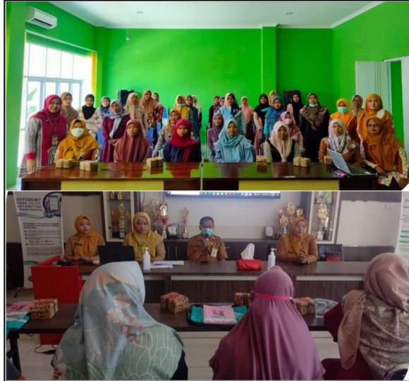
Pendampingan Ibu Hamil Risti