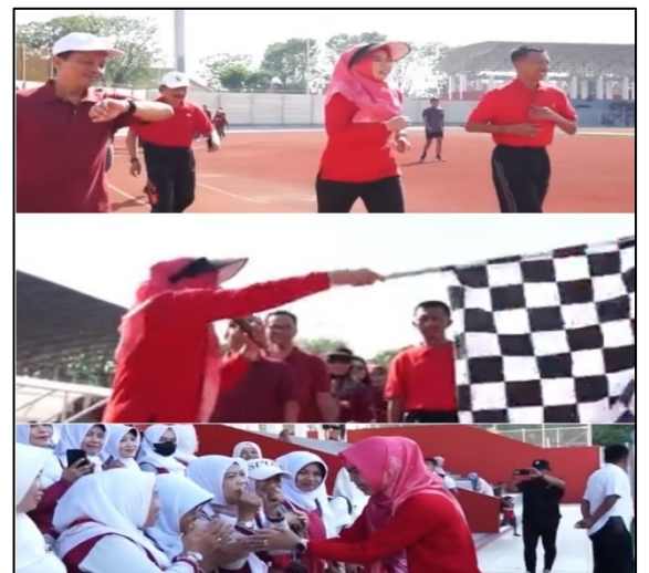
Kegiatan Rockport sebagai Pengukuran tingkat kebugaran