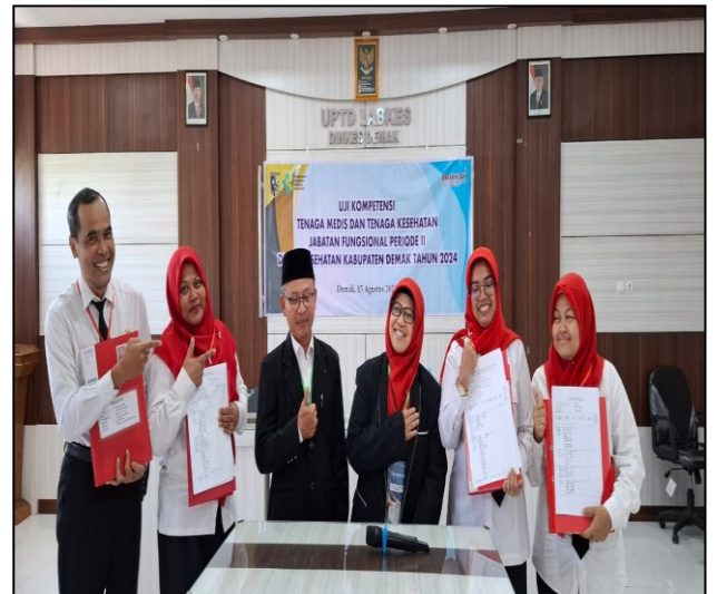
Pelaksanaan Uji Kompetensi SDM