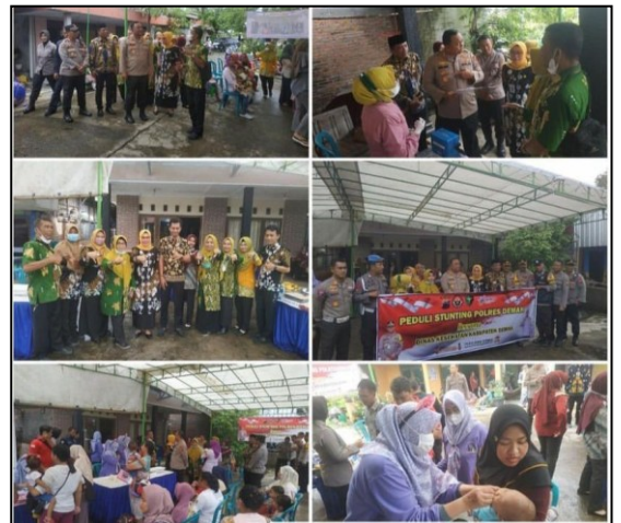
Kegiatan Peduli Stunting bersama Polres Demak