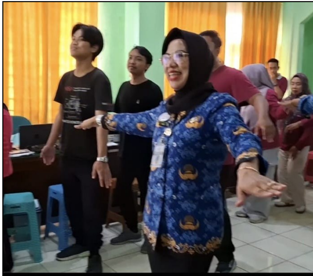
Peregangan bersama pada jam kerja di Lingkungan DINKESDA